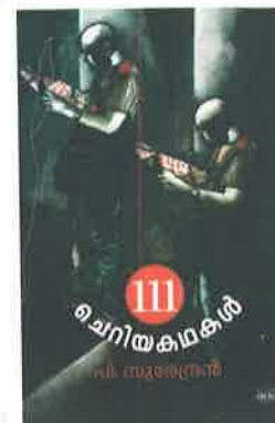
111 ചെറിയ കഥകൾ