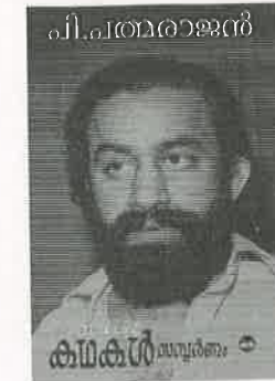
പത്മരാജന്റെ കഥകൾ സമ്പൂർണ്ണം Rs. 375