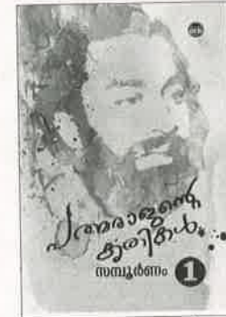
പത്മരാജന്റെ കൃതികൾ സമ്പൂർണ്ണം (2 വാല്യങ്ങൾ) Rs. 1250