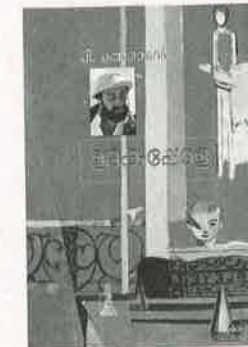
ഉദകപ്പോള Rs. 110