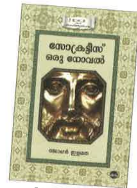
സോക്രട്ടീസ് ഒരു നോവൽ ജോൺ ഞാനെ