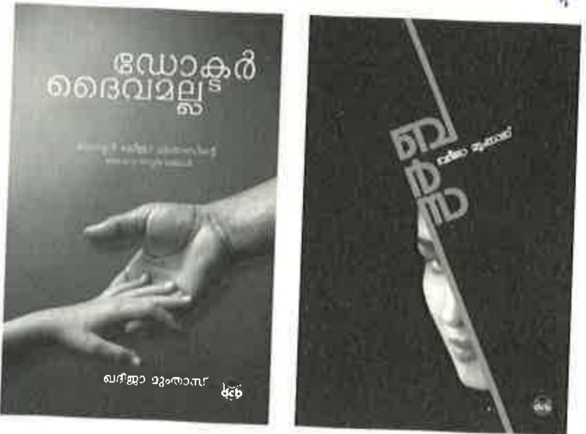
വദിജാ മുന്താസിന്റെ ഞങ്ങൾ പ്രസിദ്ധീകരിച്ച കൃതികൾ