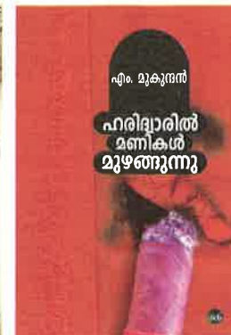
ഹരിദ്വാരിൽ മണികൾ മുഴങ്ങുന്നു