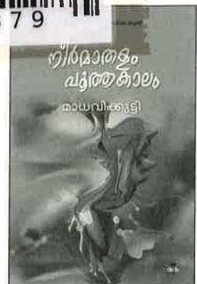
മാധവിക്കുട്ടിയുടെ കഥകൾ സമ്പൂർണ്ണം