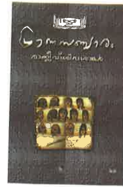
പ്രാണസഞ്ചാരം രാജീവ് ശിവശങ്കർ