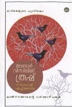
മലബാർ വിസിലിങ്ങ് ത്രഷ്