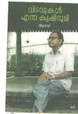
വിടവുകൾ എന്ന കൃഷിഭൂമി

കാഴ്ചപ്പാടുകളെ പുതുക്കുന്ന ആഴമുള്ള വായനയ്ക്ക്