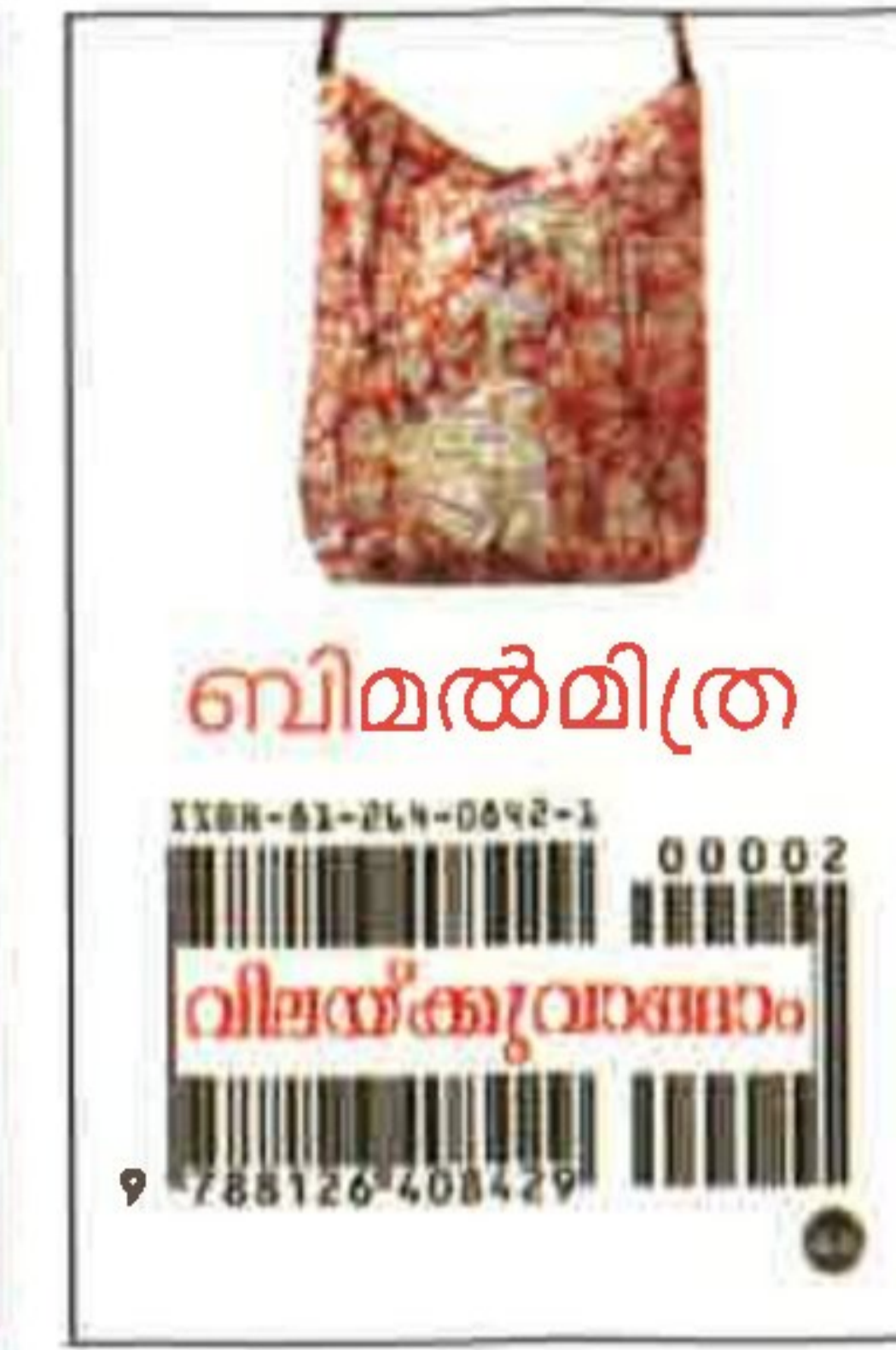
ബിമൽമിത്രം വിലയ്ക്കുവാങ്ങാം ബിമൽ മിത്രം