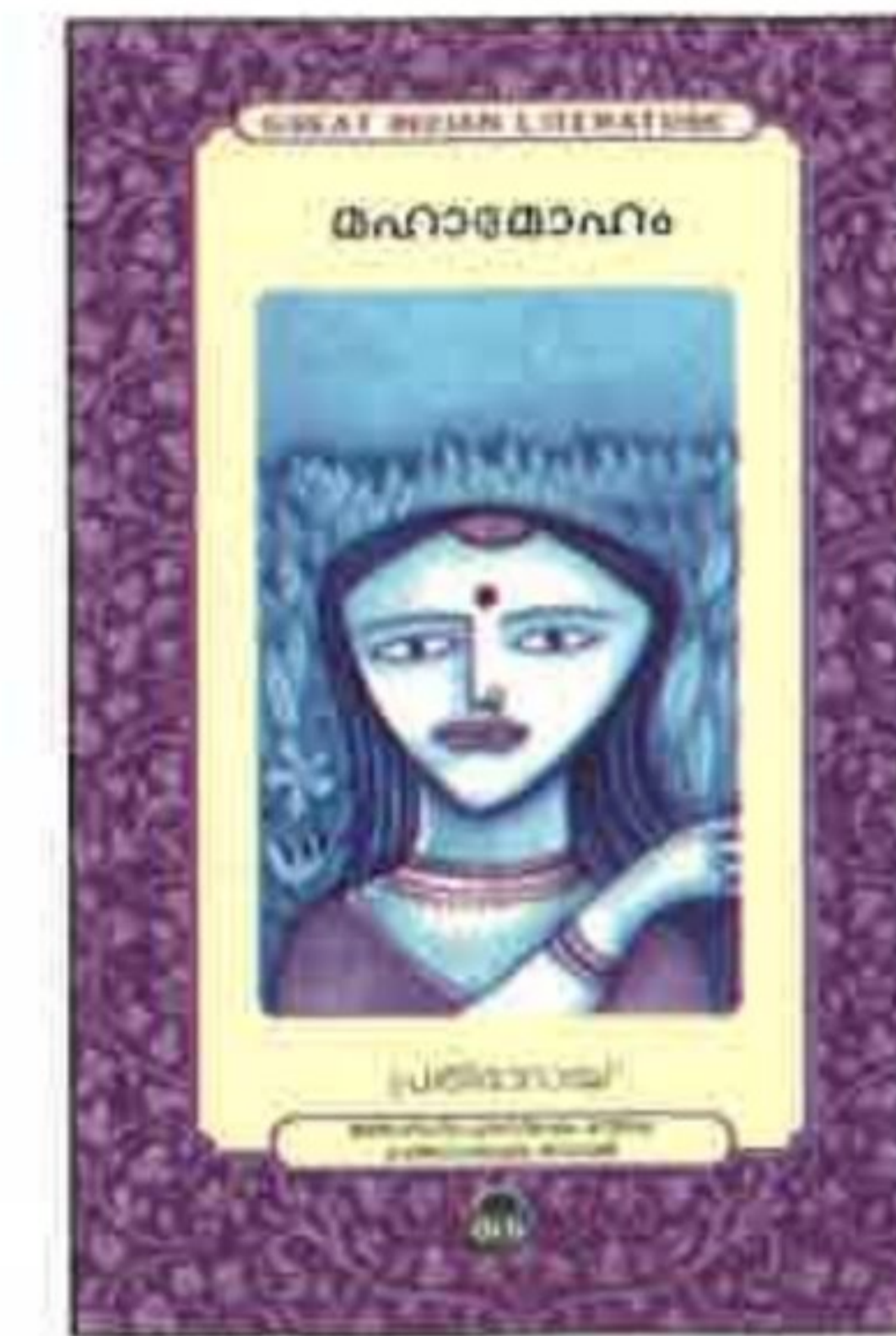
മഹാഭാരതം പ്രതിഭാ നായ്